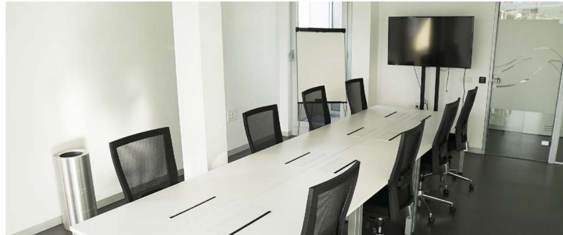
Sala de reuniones en Edificio Incube