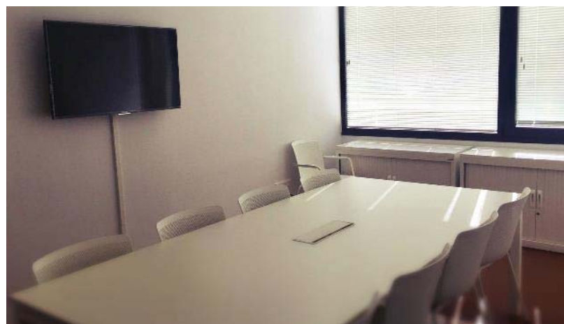
Salas de formación I y II en Edificio Polivalente III