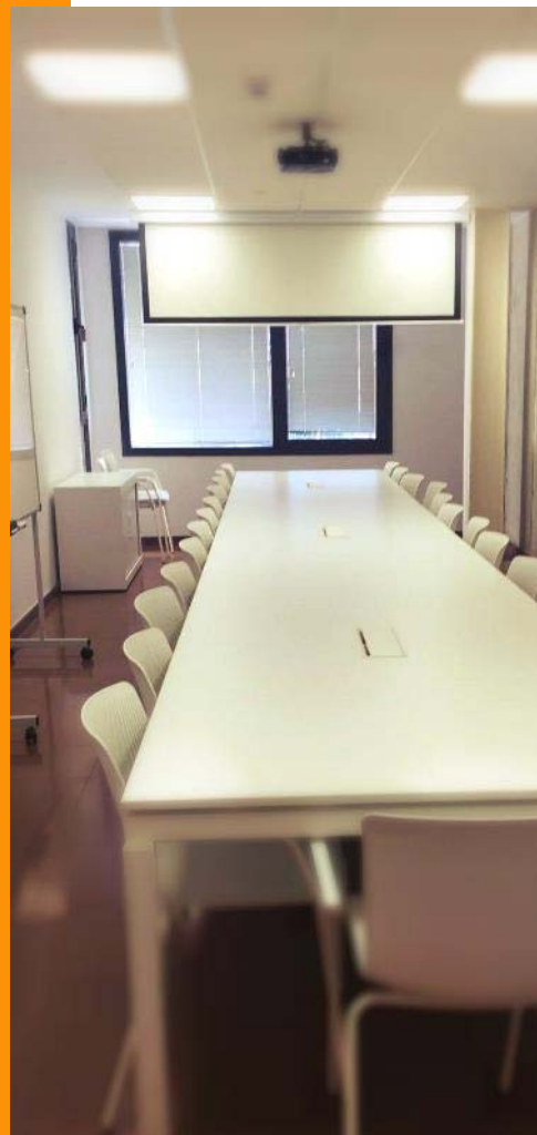
Sala de juntas B en Edificio Polivalente III