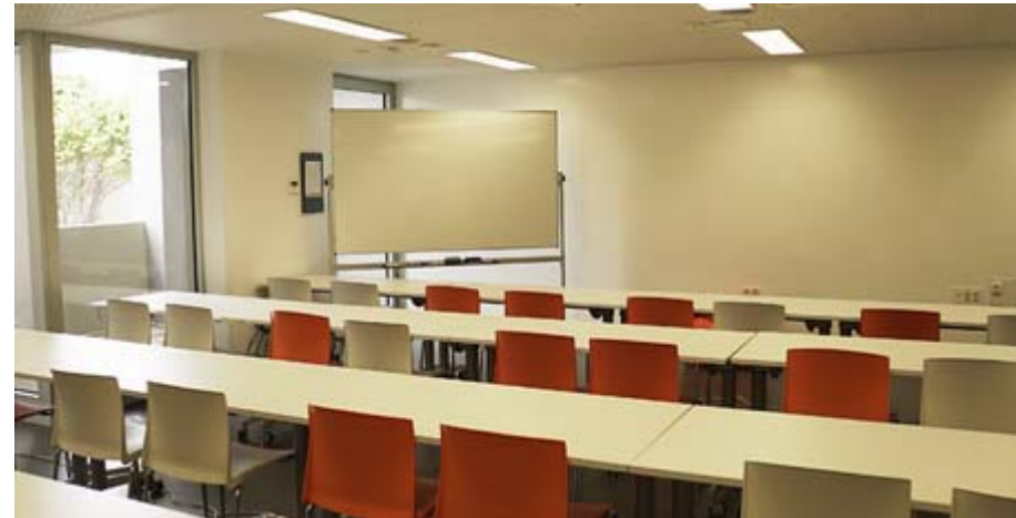
Sala Global 30 en Edificio Incube