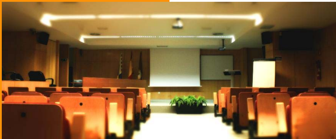
Salón de actos en Edificio Polivalente I