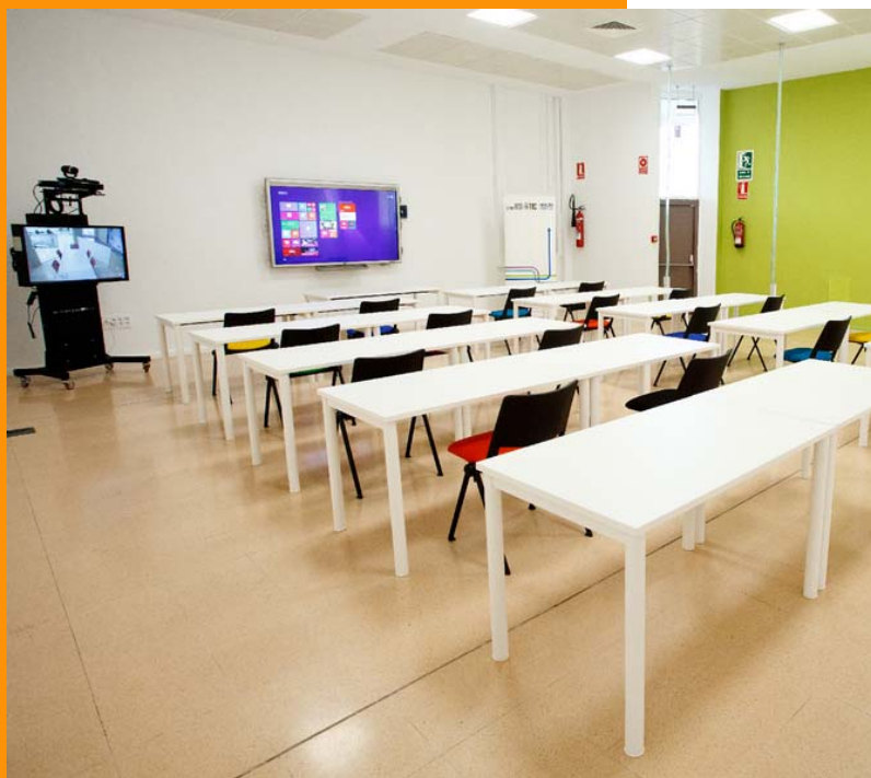
Sala de formación en Edificio CDTIC