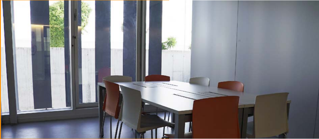
Sala de reuniones en Edificio Pasarela