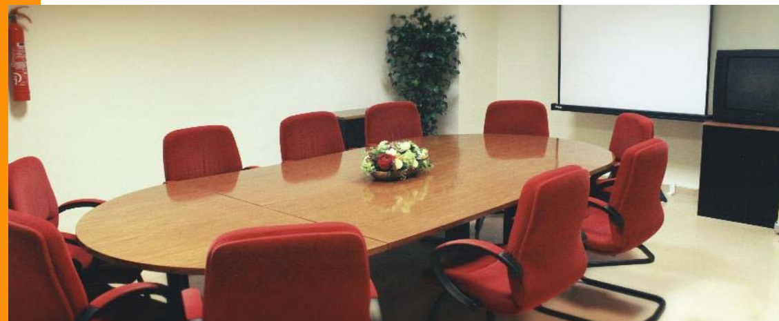
Sala de reuniones en Edificio Polivalente I