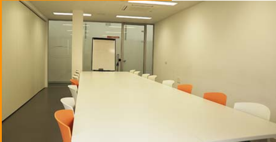
Sala Global 20 en Edificio Incube